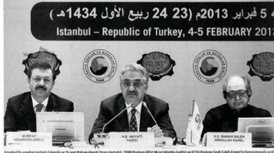
İstanbul'da yapılan toplantı Gümrük ve Ticaret Bakanı Hayati Yazıcı (ortada), TOBB Başkanı Rifat Hisarcıklıoğlu (solda) ve ICCIA Başkanı Şeyh Saleh Kamel'in katılımlarıyla yapıldı.

fat Hisarcıklıoğlu, ICCIA Başkanı Şeyh Saleh Kamel ve İslam İşbirliği Teşkilatı üyesi Mısır, Uganda, Nijer, Suudi Arabistan, Birleşik Arap Emirlikleri, Pakistan, İran, Sudan, Umman, Kuveyt, Ürdün ve Katar'ın oda başkanları ve temsilcileri katıldı. İslam ülkelerinin birbirleriyle olan ticaretinin toplam dış ticaretlerinin ancak yüzde 17'sine karşılık geldiğini hatırlatan Yazıcı, "Bu seviyeyi çok daha ileri noktalara getirmeliyiz." dedi. Yazıcı, İslam ülkelerinin toplam milli gelirinde, 2002-2011 arasında diüzenli bir artış görüldüğünü vurgulayarak, 2002 başında 1,7 trilyon dolar olan milli gelirin, 2011'de 5,7 trilyon dolara yükseldiğini söyledi. İslam ülkelerinin bugün, dünya nüfusunun beşte birinden fazlasını oluşturduğuna vurgu yapan Yazıcı, "Dünya gırtlağı milli hasulası 70 milyar dolar kabul edildiğinde İslam ülkeleri bu hasulada ancak birerini üretmekte. 2007-2011 arasında İslam ülkelerinde kişi başı milli gelir 4 bin 724 doların 5 bin 507 dolara çıktısı." bilgisini verdi. Bu gelişmelere rağmen Müslüman ülkelerin zenginliği ile en fakiri arasında 220 katlık gelir dağılımı olduğunu bildiğinden dikkat çeken Yazıcı, bunun temel sebeplerinden birinin İslam ülkeleri arasındaki ticaret hac-