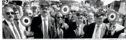
Törene katılan (soldan) TOBB Başkanı Rifat Hisarcıkılıoğlu, Ulaştırma Bakanı Binali Yıldırım ve TCDD Genel Müdürü Süleyman Karaman'ın ellerindeki levhaları aynı anda kaldırmasıyla BALO treni Manisa'dan hareket etti.

İlk tren seferinin yapıldığı törende konuşan Ulaştırma Bakanı Binali Yıldırım, Türkiye Odalar ve Borsalar Birliği'ne (TOBB) demiryolu işletmesi için teklifte bulundu. 1 Temmuz'da milletvekillerinin desteği ile demiryollarının serbestleşmesine ilişkin yasanın çıktığını hatırlatan Yıldırım, "13 bin kilometre demiryolu hattını herkes kullanabilir. Bu büyük fırsatı TOBB üyelerinin kullanması için bir yapılanmaya gidilebilir" dedi.