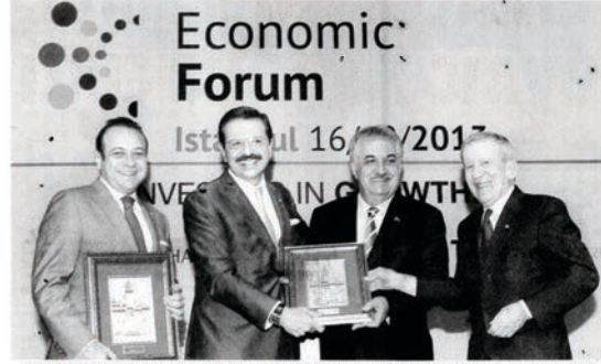
TOBB Başkanı Hırcıoğlu (soldan ikinci) AB Bakanı Yermes Bağış, Gümrük Bakanı Hayati Yazıcı ve EUROCHAMBRES Başkanı Barberis'te planet verdi.