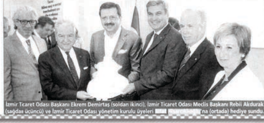
İzmir Ticaret Odası Başkanı Ekrem Demirtaş (soldan ikinci), İzmir Ticaret Odası Meclis Başkanı Rebil Akdurak (sağda üçüncü) ve İzmir Ticaret Odası yönetim kurulu üyeleri Rifat Hisarcıkloğlu'na (ortada) hediye sundu.

Bunların çözümü için tek bir yolun olduğunu söyleyen Hisarcıkloğlu, "Ekonomik olarak kaybetmemenin yolu da bu meseleleri tartışırken birlik ve beraberliğin bozulmamasından geçiyor. Tüccar ve sanayici barışın temsilcileridir. İki dünya savaşını yaşayan Fransa ve Almanya'yı bir araya getiren işadamlarıdır. Bu ülkenin huzuru, refahı ve zenginliğini istiyorsak birlik ve beraberliği korumak için çalışmalıyız" dedi.