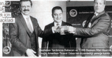
Başbakan Yardımcısı Babacan ve TOBB Başkanı Rıfat Hisarcıklıoğlu, Amerikan Ticaret Odası'nda görüşüyor.

Babacan şunları söyledi: "Yatırım, üretim, ihracat için olan kredilerin maliyetleri düşük olmalı. Biz hep bunu istiyoruz. Bu tür büyümeyi destekliyoruz. Bu kapsamda, BDDK ve Merkez Bankası makro ihtiyati tedbirlerle ilgili ortak çalışma yapıyor. Yılın ilk yansı bitmeden maliyetler konusunda önemli adımlar atılabilir. Yeni IMF ve Dünya Bankası