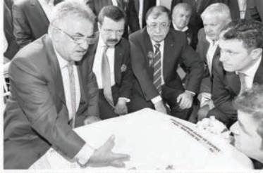
60 bin metrekaresi kapalı olmak üzere toplam 220 bin metrekarelik alana sahip yeni Halkalı Gümrük Müdürlüğü binasının temel atma törenine Gümrük ve Ticaret Bakanı Hayati Yazıcı da katıldı.

HALKALI Gümrük Müdürlüğü Büyükçekmece'ye taşınıyor. Yap-İşlet Devret modeli ile Büyükçekmece'de inşa edilecek olan Halkalı Gümrük Müdürlüğü'nün yeni tesislerinin (Lojistik Merkezi) temeli dün atıldı. Törene katılan Türkiye Odalar ve Borsalar Birliği (TOBB) Başkanı Rifat Hisarcıkloğlu, "Halkalı Gümrüğü'nü Büyükçekmece Çatalca Bölgesi'ne taşıyoruz. Bu yatırıma 154 milyon TL harcayacağız. İnşallah Mart 2014'te tamamlayarak ihracatçılarımızın ve ithalatçılarımızın hizmetine sunacağız" dedi. Halkalı Gümrüğü'nün Büyükçekmece'ye taşınması ile