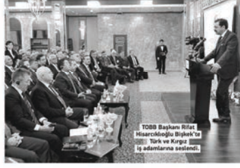
TOBB Başkanı Rifat Hisarcıklođlu Bıřek'te Türk ve Kırgız iş adamlarına seslendi.

Turizmin geliştirilmesi için işbirliği öneren Hisarcıklođlu, iki ülke iş adamları arasında gerçekleştirilecek şu önerileri dile getirdi: "Alternatif ulařtırma imkanları gerekiyor, İpekyolu'nu geniş tren ađlarıyla, otobanlarla yeniden canlandırmalıyız. Kırgızistan'ın yüzyılımızın projesi olan İpekyolu'nun canlandırılması sürecine katılımı gerekir. Kırgız gümrüklerinin modernizasyonu için her türlü desteđi vermeye hazırız."