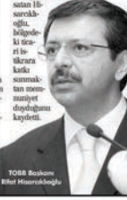
TOBB Başkanı Rifat Hisarcıkılıođlu

Afrika çölüne kadar her yerde geçişlere hayatı geçiriyorlar. Milyonlarca insan sadece son 4 yılda, sadece 40 yılda yaptıklarından fazla iş harcamıyor olabilir. Ve büyük birlet sayısındadır. Çir den sonra 2. sıraya yükseldik. Başarları nasıl başarıldı? Özel sektöre gelirken, rekabete açarak, dünya ile entegre ederek başarıldı." Kerkilinin Filistin ve İsrail'i ayırdıkları zaman tabii ki kararla ortak solum me-karizmasını başkalarını ise-